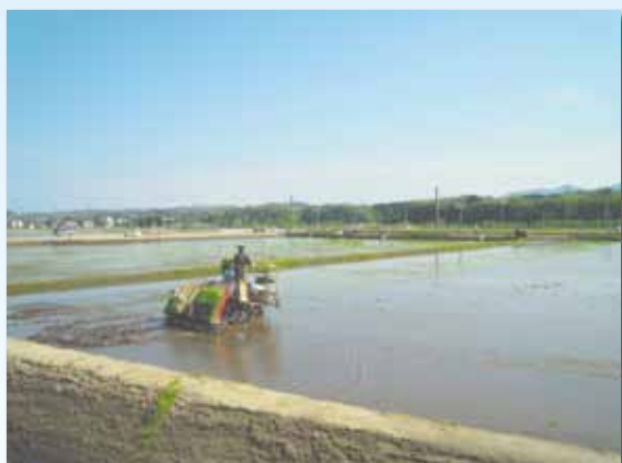
整備されたほ場での田植え作業 上小国地区（外ヶ浜町）

農業農村整備は、「攻めの農林水産業」の強力かつ着実な推進に資するため、安全・安心な食料を安定的に供給するための農業生産基盤づくりや農業水利施設の長寿命化、農業・農村の多面的機能の発揮に向けた農村の地域資源の適切な保全管理や農村生活環境の整備などを図ることにより、「元気あふれる自主自立の農業・農村の創造」を目指しています。