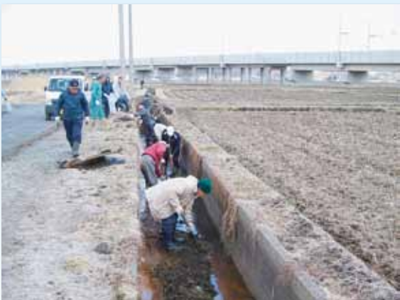
農地・水保全管理支払交付金による共同活動 新和地区資源保全隊（八戸市）