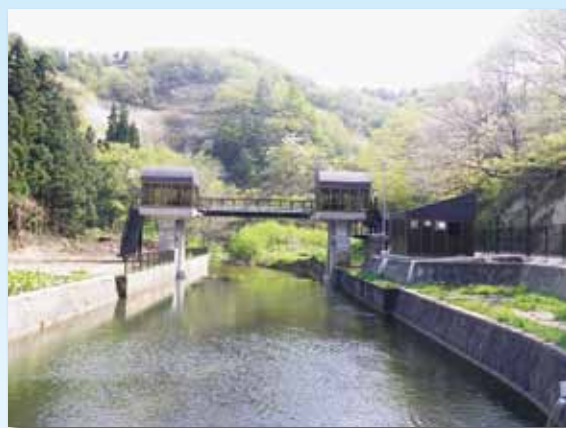
小田川頭首工 おだ がわ 小田川二期地区（五所川原市、中泊町）