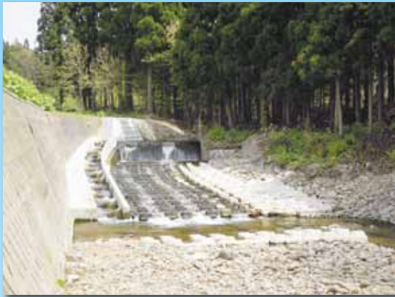
魚道の整備 安兵衛地区（今別町）