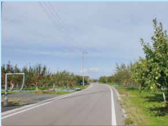
樹園地農道の整備 下湯口地区（弘前市）