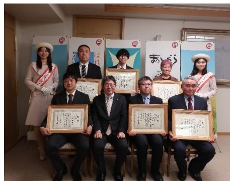
昨年の受賞者の皆様

各品種 1 位の出品者をグランプリ、2 位の出品者を準グランプリとして表彰する（賞状、副賞贈呈）。 表彰式は、令和 8 年 12 月に開催する。