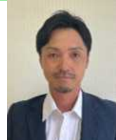
神 文人 鱒ヶ沢町