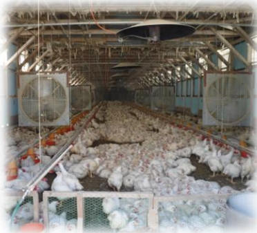
扇風機による送風