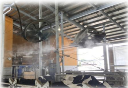
牛舎細霧(アグリ熊本HP引用)