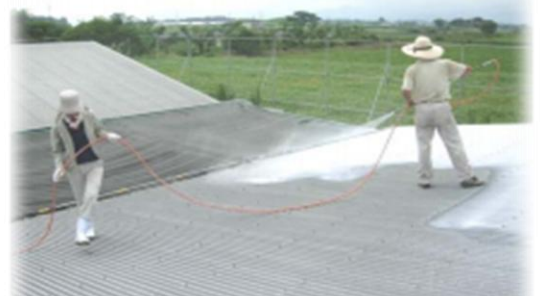
屋根への石灰塗布