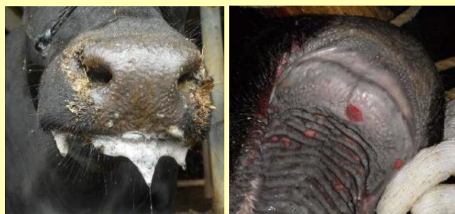
泡状のよだれ 口蓋のびらん