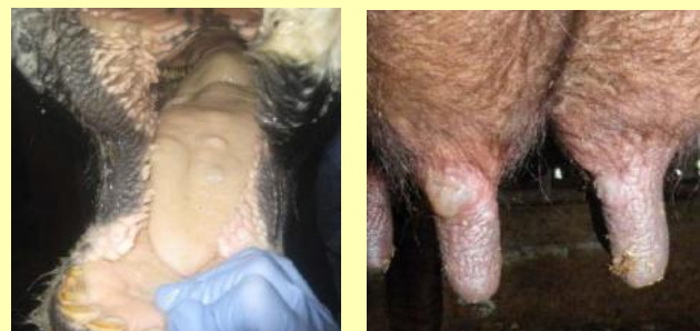
舌の水疱 乳頭の水疱