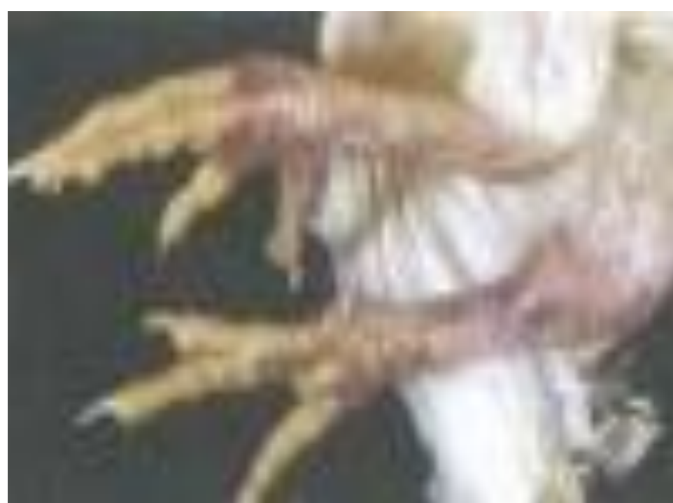
写真3 皮下出血 (真瀬昌司・谷村信彦原図)