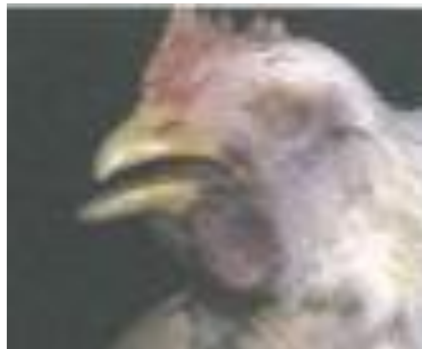
写真4 肉垂のチアノーゼ