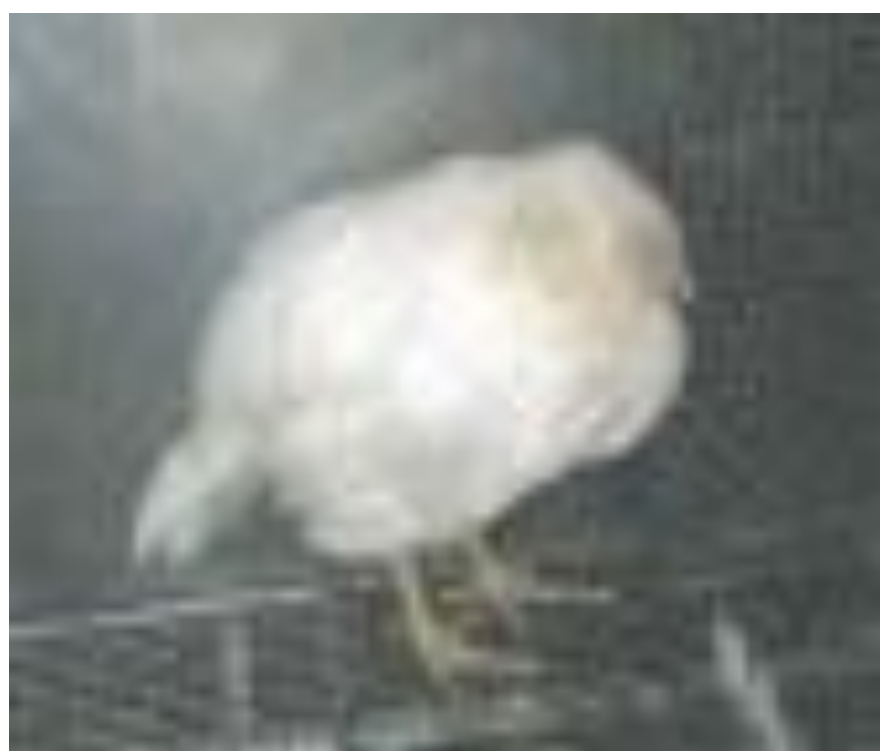
写真1 元気消失 (真瀬昌司原図)