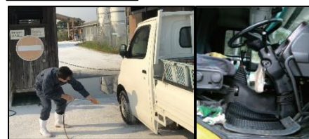
タイヤだけでなく、 泥よけの内側まで消毒 。 フロアマットの交換やペダル等、車内も消毒 。