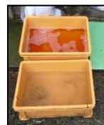
推奨される踏込消毒槽の設置方法！