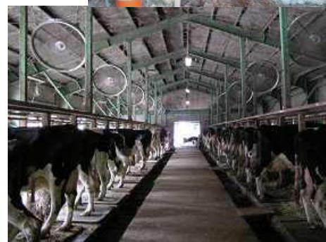
扇風機による送風