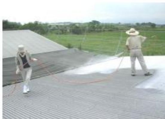
屋根への石灰塗布