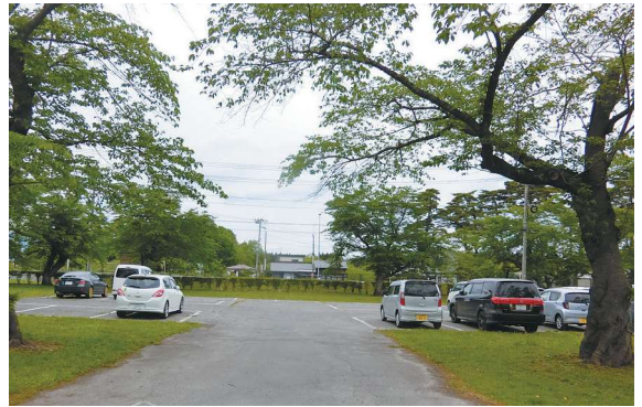
近隣の学生は通学も可能