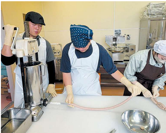
ソーセージ加工実習

地域の6次産業化を担う人財を育成するため、農畜産物の加工技術や商品設計、マーケティングに基づく販売等を学びます。