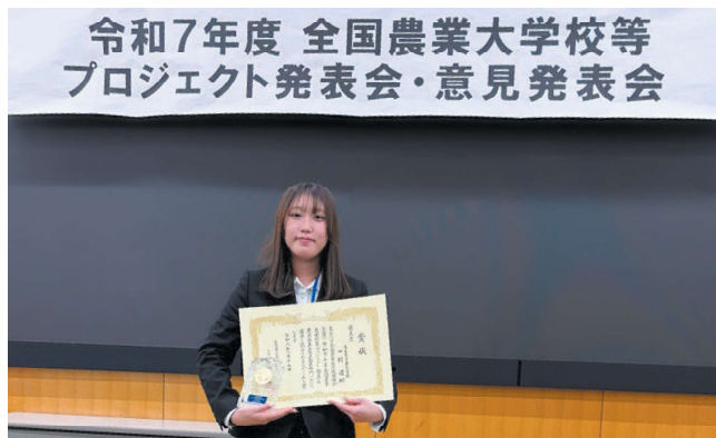
② 全国プロジェクト発表会