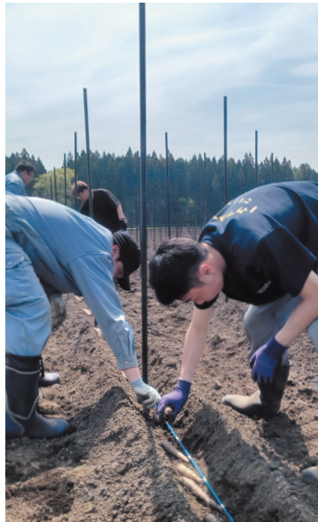
ながいも植え付け