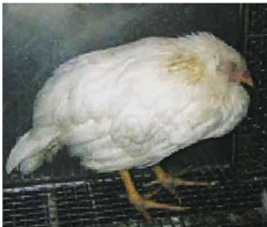
写真1 元気消失 (真瀬昌司原図)