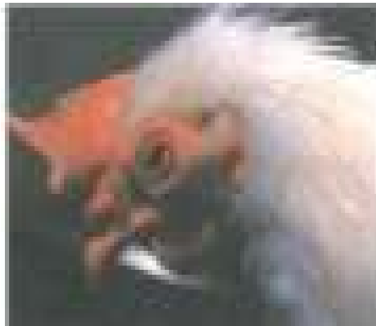
写真2 沈うつ