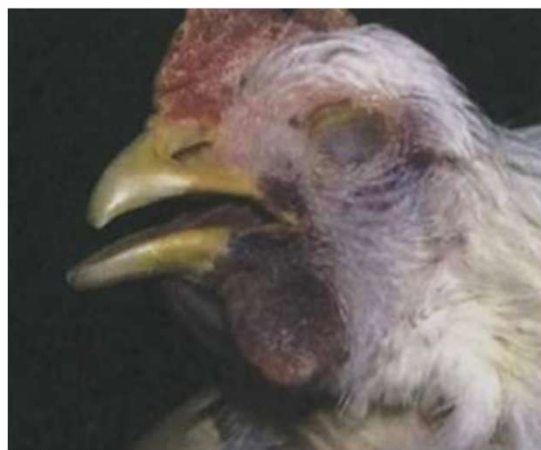
写真4 肉垂のチアノーゼ (動物研究所提供)