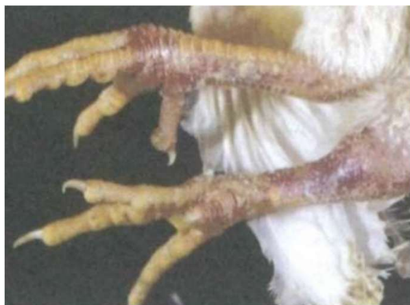
写真3 皮下出血 (真瀬昌司・谷村信彦原図)