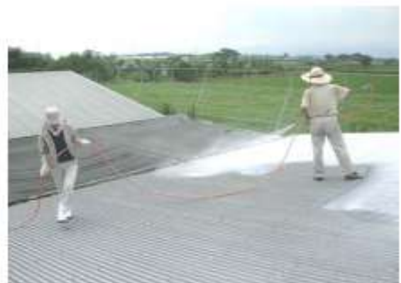
屋根への石灰塗布