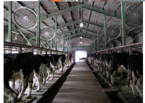
扇風機による送風