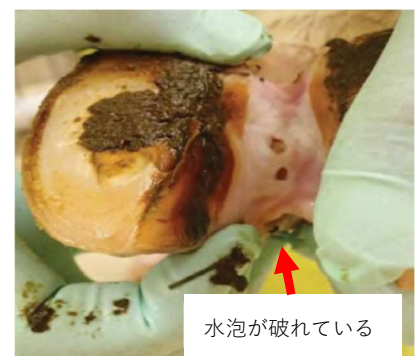
水泡が破れている