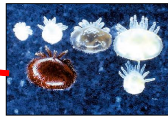
ミツバチヘギイタダニ