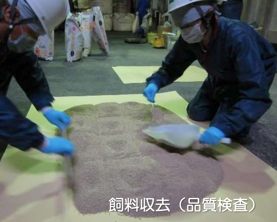
飼料収去（品質検査）