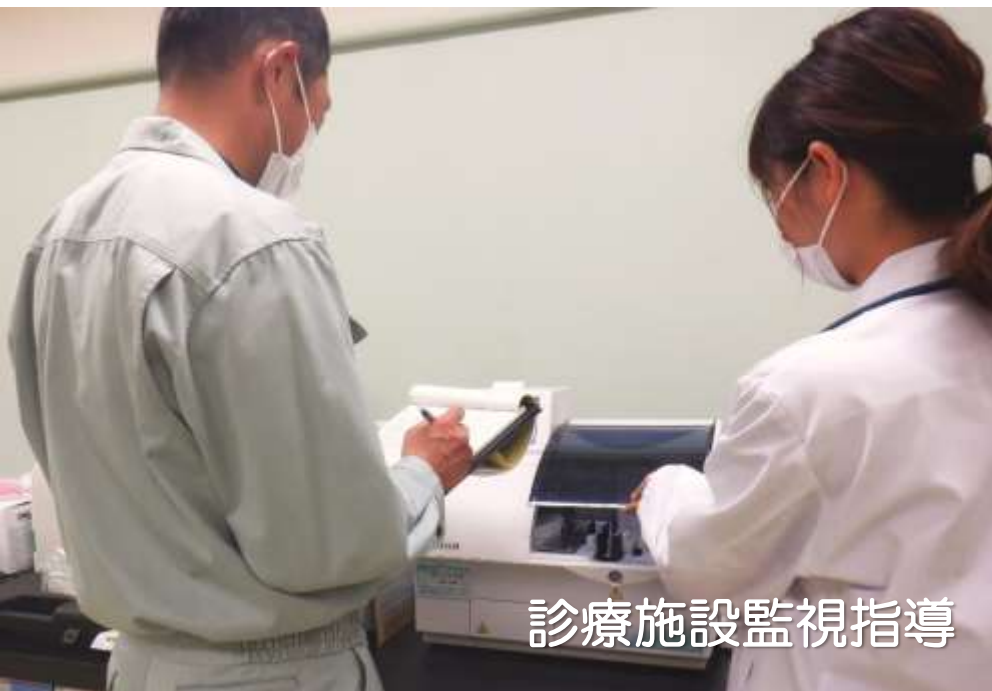
診療施設監視指導