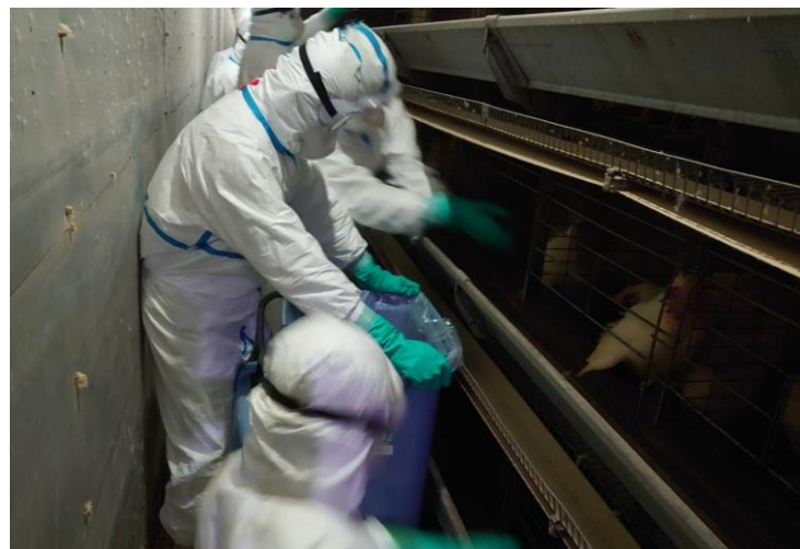
②2022. 12. 25 (19-20 時) 防疫作業の様子 2