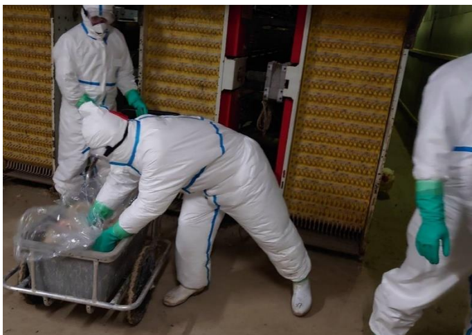
①2022. 12. 25 (19-20 時) 防疫作業の様子 1