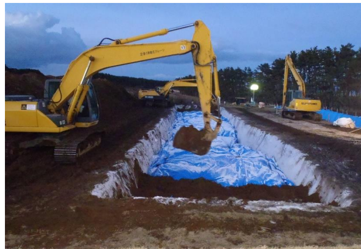
④2022. 12. 25 (16-17 時) 埋却作業の様子