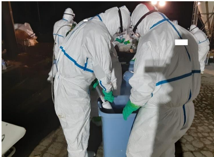
③2022. 12. 26 (2-3 時) 防疫作業の様子 3