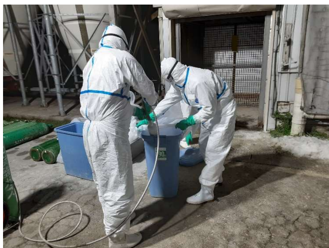
③2022. 12. 25 (1-5 時) 防疫作業の様子 3