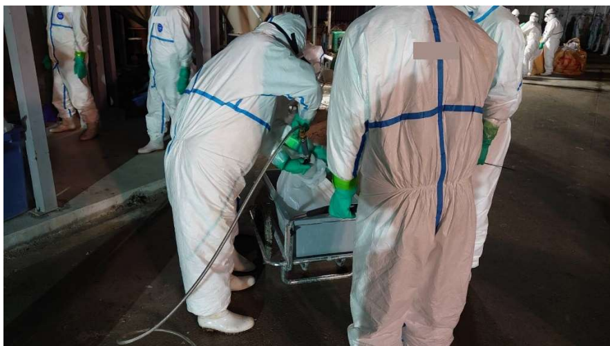
①2022. 12. 24 (20-22 時) 防疫作業の様子 1