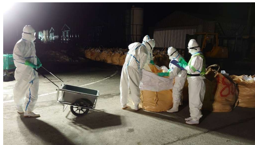
②2022. 12. 24 (20-22 時) 防疫作業の様子 2