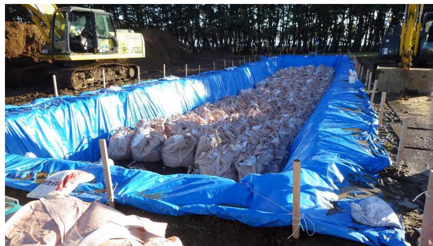
④2022. 12. 22 (12 時頃) フレコンバックの投入作業