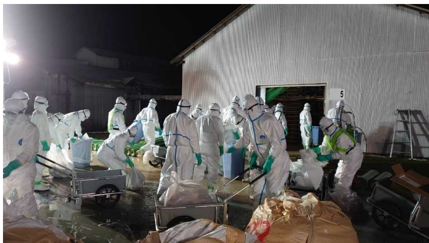
③2022. 12. 22 (13-19 時) 県職員等による防疫作業 3