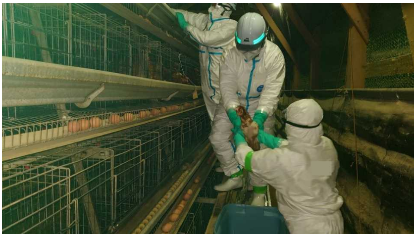
①2022. 12. 22 (13-19 時) 県職員等による防疫作業 1