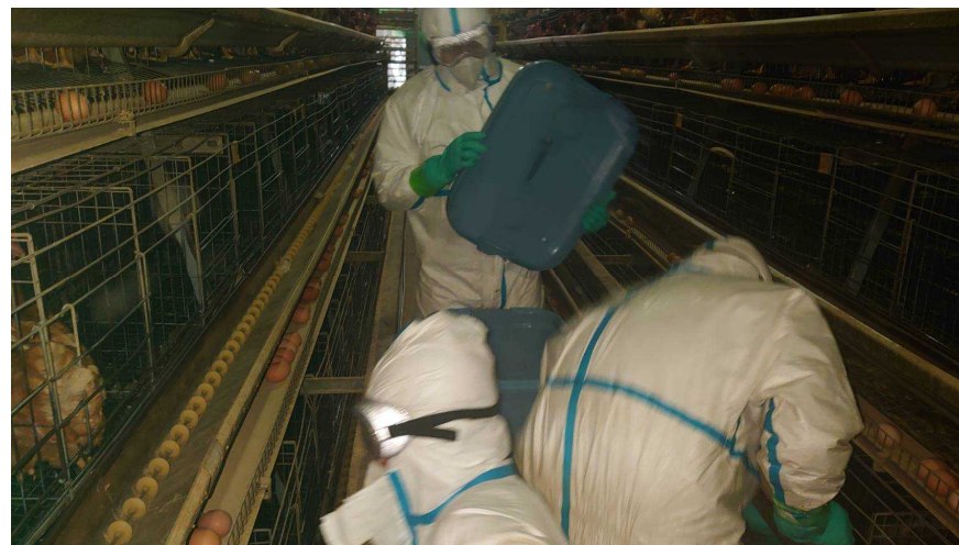
②2022. 12. 22 (13-19 時) 県職員等による防疫作業 2