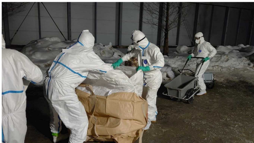
①2022. 12. 21 (16-18 時) 県職員による防疫作業 1