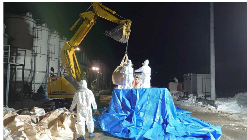
②2022. 12. 21 (16-18 時) フレコンバッグの積み込み作業 2