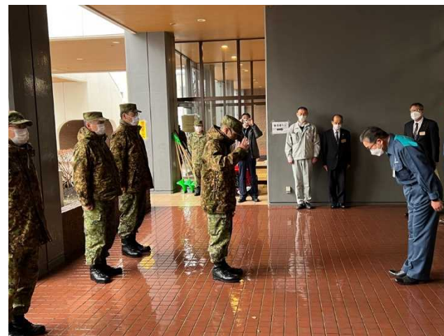
④2022. 12. 22 (11 時頃) 自衛隊災害派遣終了に伴う部隊長報告式 2