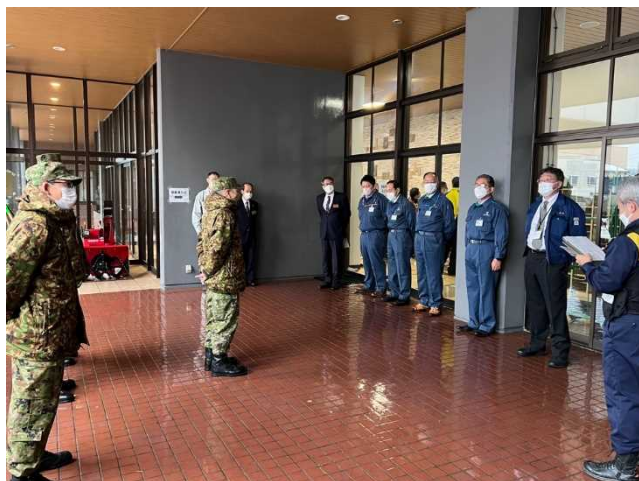
③2022. 12. 22 (11 時頃) 自衛隊災害派遣終了に伴う部隊長報告式 1