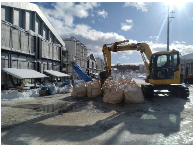
①2022. 12. 20 (13 時頃) 自衛隊による防疫作業の様子 1