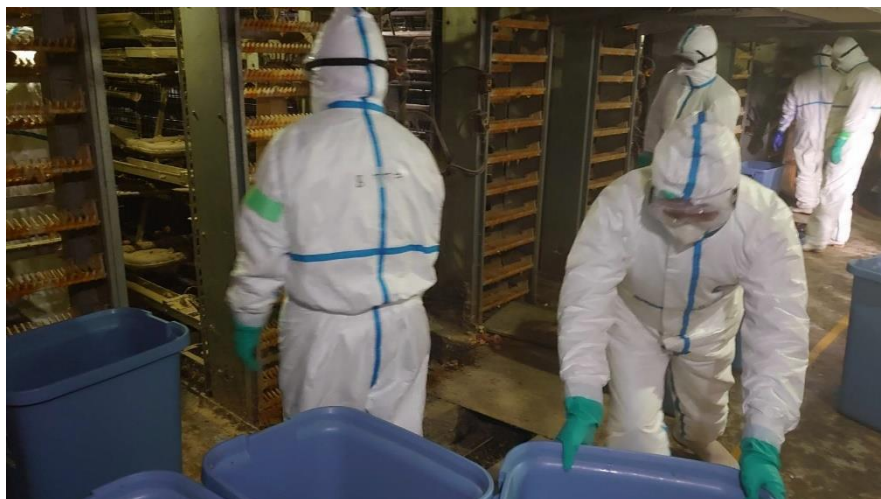
③2022. 12. 20 (18 時頃) 県職員による防疫作業の様子 1