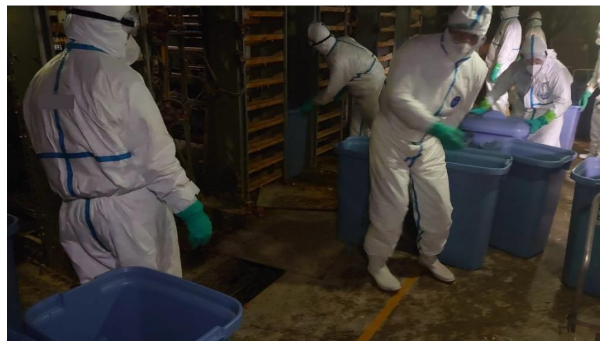
④2022. 12. 20 (18 時頃) 県職員による防疫作業の様子 2