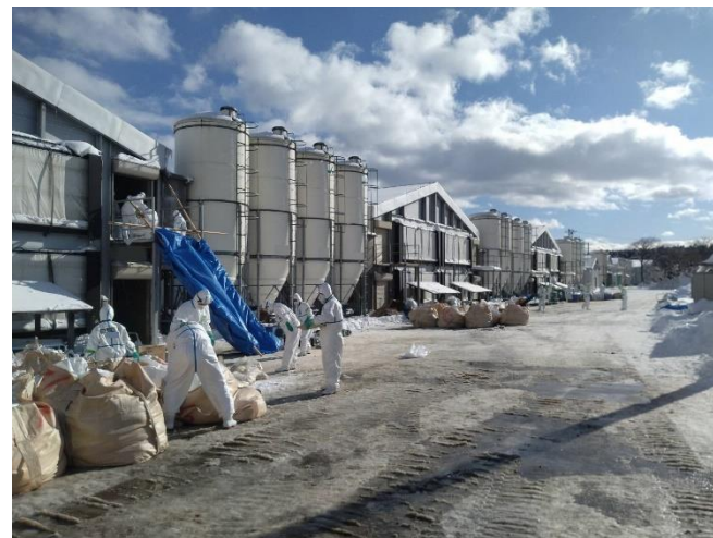
②2022. 12. 20 (13 時頃) 自衛隊による防疫作業の様子 2