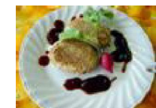
069 じゃがいもとホタテのごま焼き