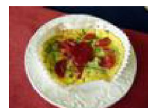
284 長芋入りキッシュ風 オムレツ