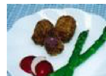
005 長いもミココック三色味揚げ