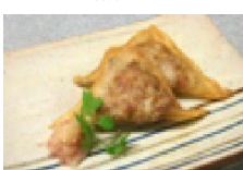
252 パリパリ りんご包み