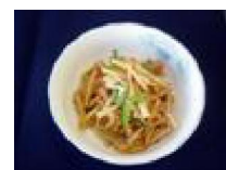
271 大天角の チンジャオ風