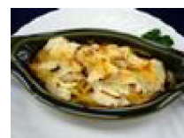
183 長芋と帆立の グラタン