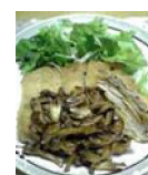
261 トンちゃんも びっくり