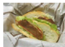
055 りんご豚のサンド