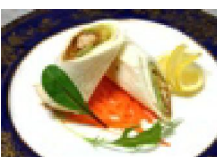
068 鰯の照焼きロール〜林檎ソースがけ〜