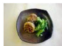
217 椎茸の 包み焼き煮