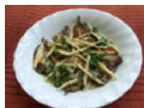
171 背黒いわしと ごぼうのピザ風