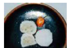
045 長いものチャーハン包み