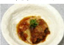
143 豚バラ肉の りんごジャム煮