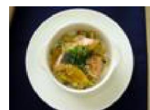
268 鮭の豆乳 グラタン