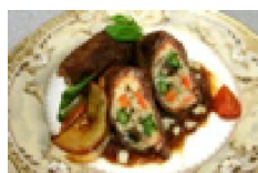
002 肉巻き林檎の照り焼き