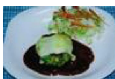
182 ホタテ入り チーズバーグ