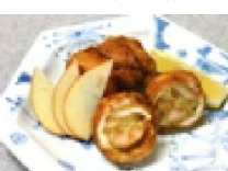
255 ささみとりんごの 唐揚げ