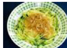
065 音喜多家直伝じゃじゃ麺