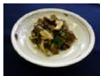
164 舞茸と牛肉の 甘辛煮