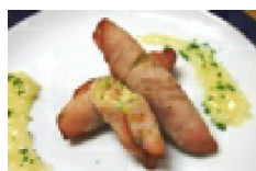
057 ポテハム巻きアップルソースがけ