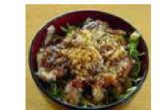
064 揚げないソースカツ丼