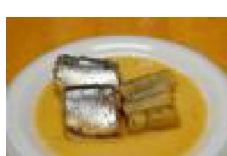
187 サンマの レンジ煮