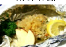
149 リンゴと鶏の ホイル焼き