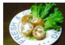
054 長芋とチーズの豚野菜ロール揚げ