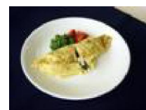
282 青菜とニュー コンビーフのオムレツ