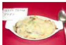
167 ほたてとアスパラの グラタン