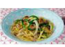
124 スタミナ スパゲッティ