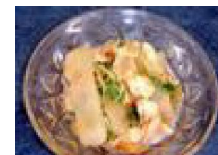
161 水菜のサラダ (タマネギソース)