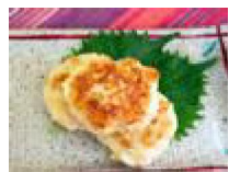
162 変幻自在! 長芋鶏つくね風