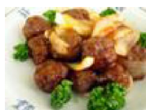
257 シャキシャキ りんご肉ダンゴ