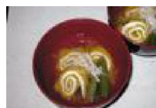
176 いか巻きのお吸い物