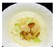
082 ほたての クリームスパゲッティ