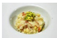
095 アップルリゾット