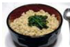
001 そぼろにほうれん井