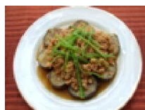
154 なすのそぼろ みそかけ