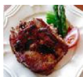
258 シューシーシャモロック の初恋ソース