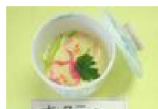
181 ホタテの かくれんぼ