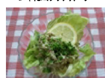
150 鶏肉の アボガドサラダ