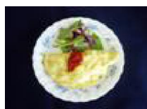
283 長芋入り スパニッシュオムレツ