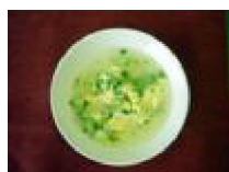
267 ちりめんじゃこの スープ