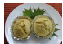
110 バナナときな粉の ケーキ