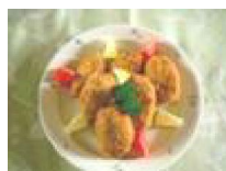
003 シャキシャキもちもちミンチコロッケ