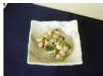
158 豚肉とにんにくの 落とし揚げ