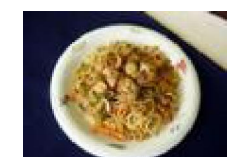
127 ホタテキムチ味 焼きそば