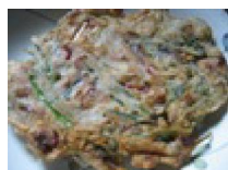
073 オシオフチンゲ (いかチヂミ)