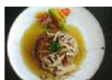
138 おからの 和風ハンバーグ