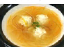
144 サッパロりんご つくねコンソメスープ