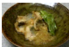
264 鱈の 林檎おろし煮