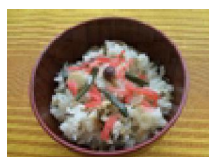
029 山菜の炊き込みご飯