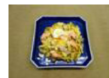
184 キャベツと生鮭の 蒸し焼き