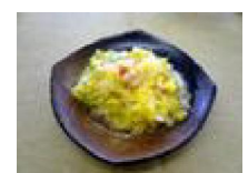
193 白菜とかに缶の トロ煮