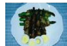
041 アスパラの長いも巻き