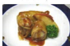
141 林檎と豚肉の 白菜ロール