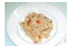
016 ホタテとイカのにんにくヒラ風味