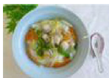
074 ホタテ入り中華飯 (塩味)