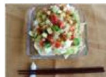
166 スタミナ 豆腐サラダ