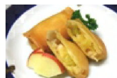
009 林檎の白味噌焼き