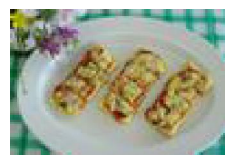
018 ながいものかりかり油あげピザ