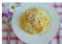
008 とろ〜りカルボナーラ