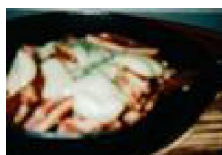
263 イカの チーズ焼き