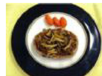
160 長いも入り ハンバーグ