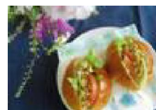
004 意外と合うそぼろスパイシーバーガー