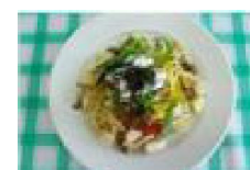
027 和風きのこパスタ〜海と山のコラボレーション