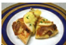
056 リンゴと肉じゃがの和風ピザ