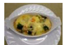
185 鱈の 長芋チーズ焼き