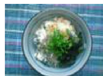
075 海の幸入り マヨとろ丼