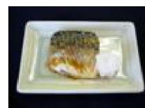
276 焼鯖の生姜 じょうゆ浸し