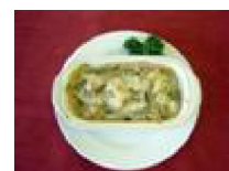
277 帆立とウルの グラタン