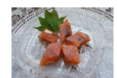
151 のど越しの良い 簡単かんてん