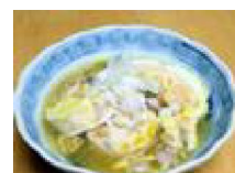
279 豆腐の 生湯葉風煮物