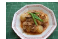
059 ケチャップじょうゆ風味の肉じゃが