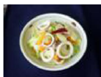
269 イカの さっぱり浸し