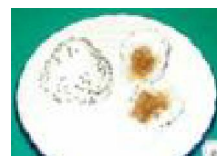
060 甘辛にんにく味噌おにぎり