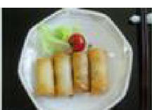
123 長芋の もっちり春巻き