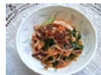
172 もやしと 海鮮キムチ