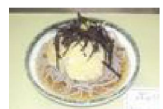
120 ぶっかけ長いも 焼そば