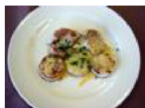
262 鶏肉のチーズ焼き