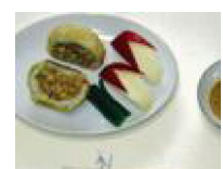
213 芋まんじゅうの あんかけ