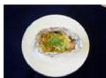
273 鮭のみそ マヨネーズ焼き