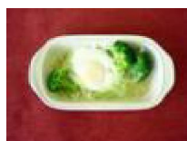
285 レンジで 目玉焼き