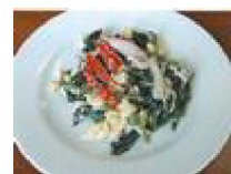
165 ほうれん草 マヨネーズ和え