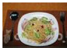
010 いかとキャベツのスパゲッティ