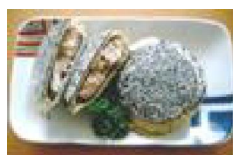
062 シャモロックせんべいバーガー