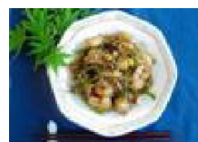
179 じゃこと炒めて なんぼ