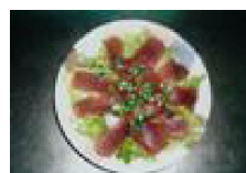
175 まぐろの カルパッチョ