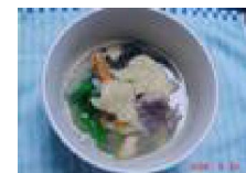
014 我が家のひみつひつまみ