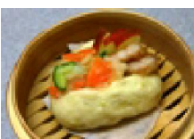
058 林檎ソースの豚バラサンドパン