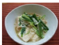
021 グリーングリーン