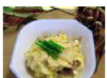
137 はくさいと 豚肉の卵とじ