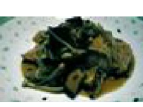
188 鮭のソテー 和風きのこソース