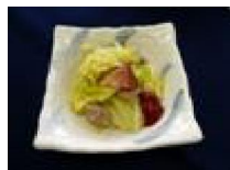
157 キャベツの 重ね煮