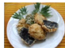
266 ほっけすり身 おせんべ風