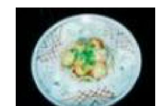
135 青森肉団子 リンゴ甘酢和え