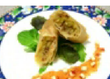
105 林檎ゴック春巻き 林檎酢がけ