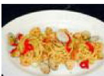
080 イビとアサリの Pasta