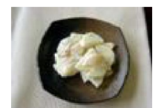
186 長芋とホタテの マヨネーズ和え