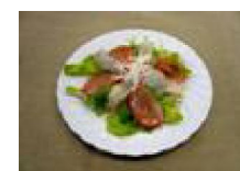
189 ひらめと長ねぎの カルパッチョ