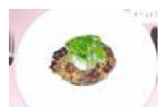
136 マルっとほたて ハンバーグ