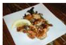
265 ガーリック シュリンプ