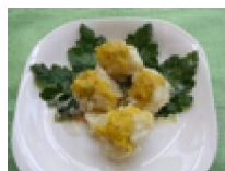
015 じゃ真いか団子菊飾り