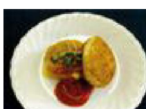
139 うまチー ハンバーグ