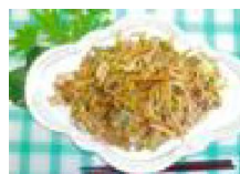
070 いかすみやきそば