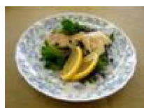
275 鱈のソテー レモンレッシング