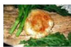
087 またぎのかやぎの にぎりままだま