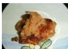
259 鶏肉の リンゴソース