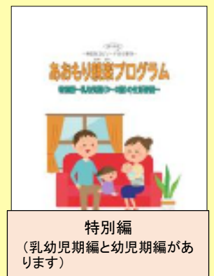
特別編 (乳幼児期編と幼児期編があります)