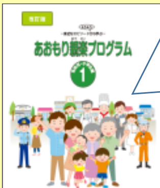
乳幼児・小学生編