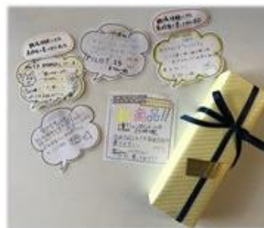
学生が作成した商品 POP