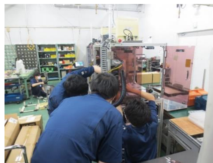
インターンシップの様子