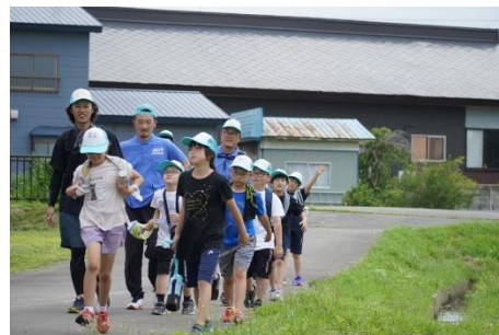
じょっぱりロード 2022 の様子