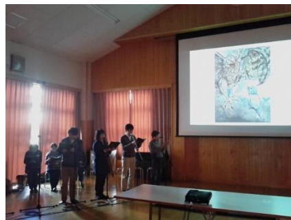
体験型出前授業の様子