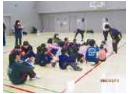
タグラグビー教室