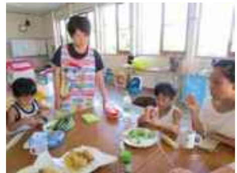
トルネードポテトづくり