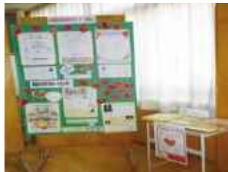
中学校文化祭での 家庭教育支援チームの紹介

多くの保護者が来場する中学校の文化祭の場で、実行委員（CSディレクター）が担当するブースの一角に、青森市家庭教育支援チームの活動報告、講座紹介や情報提供のパネル展示を行いました。保護者や地域の方、教職員はもちろん、将来親となる中学生に対しても、家庭教育の役割や重要性について周知することができました。