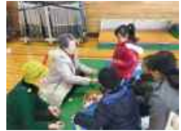
「むかしあそび」体験