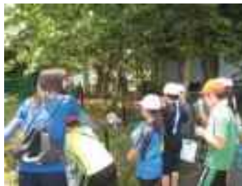
地域安全マップづくり