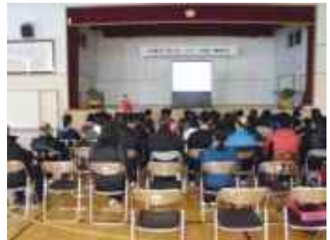
第 1 回家庭教育講演会