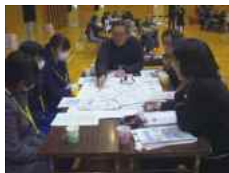
ワークショップ「みんなの学校」

青森市中央地区社会福祉協議会との協働により、地域のこれからの地域住民で考えるワークショップ「みんなの学校」を実施しました。ここでは、地域の方々が小・中学生等と同じテーブルにつき、実行委員がファシリテーターを務めながら、「通学路の雪かきはみんなで協力しよう。」「買い物の不便さは解消できる？」など、一緒になって地域のこれからの考えました。同じ地域の住民同士で、大いに交流も深めました。