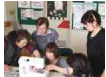
ミシンボランティアに向けての学習会