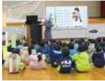
小正月行事「ほがほが」の説明

1年生活科では、五穀豊穡を願う小正月行事「ほがほが」の体験や、老人クラブの協力を得て「むかしあそび」を行いました。4年総合的な学習の時間では、各町内会役員の見守りのもと、「地域安全マップづくり」を行いました。5～6年家庭科では、地域の大人がミシンボランティアとして、児童の作業を支援しました。