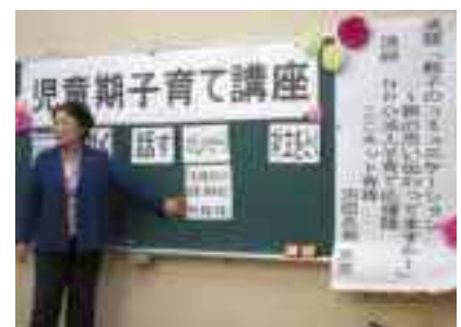
児童期子育て講座

「児童期子育て講座」では、就学時健診の際に、新入生保護者を対象として行いました。小学校入学を控え、環境の変化から心身の変化も予想される時期を乗り越えるため、親子でのコミュニケーションのとり方について学びました。