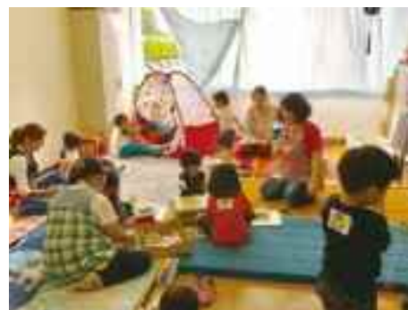
学校行事での預かり保育

利用する保護者には、預ける時間帯、子どもの年齢や緊急連絡先、兄弟の学年など事前に聞き取りし、情報をスタッフで共有し、万全の対応に努めました。また、家庭教育に関する相談にも応じました。