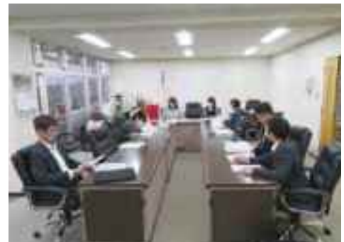
実行委員会による話合いの様子