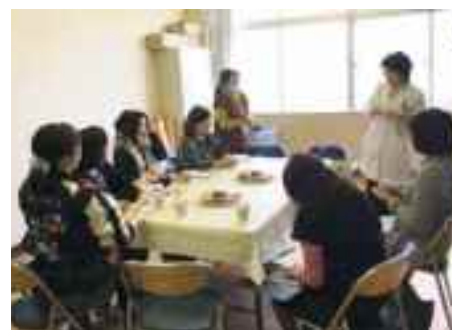
「参加者カフェ」での、講師との意見交換

講演後には、希望する保護者と講師の懇談会「参加者カフェ」を行いました。ここでは参加者と講師とが直接意見交換をし、子育てに関する多くのアドバイスをいただきました。