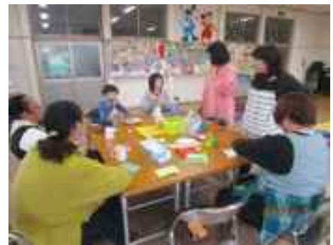
ツリーデコレーションとホットケーキづくり

参加者はスタッフと一緒に「サンドウィッチづくり」や「ハーバリウムづくり」、「トルネードポテトづくり」等、毎回バラエティに富んだ活動に楽しく取り組みながら、子育てに関する様々な情報交換を行いました。スタッフは子育て相談にも応じており、安心して子育てできる環境を整えています。