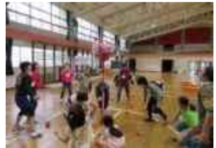
第4回（いもリンピック）

第4回は、収穫を祝して「いもリンピック」を行いました。収穫したジャガイモ等をおいしくいただくとともに、互いにレクリエーションで汗を流しました。