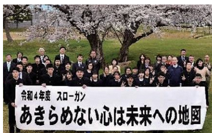
令和4年度 スローガン あきらめない心は未来への地図

また、地域ビジネス創出を目的とした「SBP研究会」では、セレクトギフト開発を行うなど、地元の良さを生徒たちが中心となり発信しています！