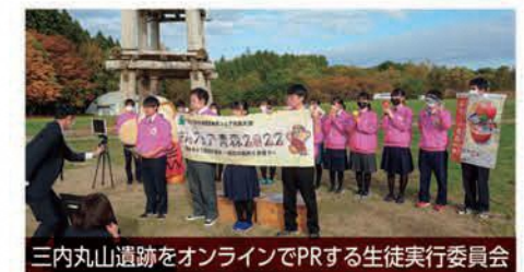
三内丸山遺跡をオンラインでPRする生徒実行委員会

現在24名の生徒実行委員会を中心に「青森らしい」大会となるよう準備を進めておりますので、皆様のご参加をお待ちしております。