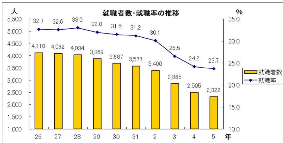
第8表の2 県内・県外別就職者数の推移