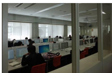
（コンピュータ実習室）