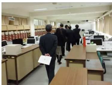
実習施設等視察 (総合実践室)