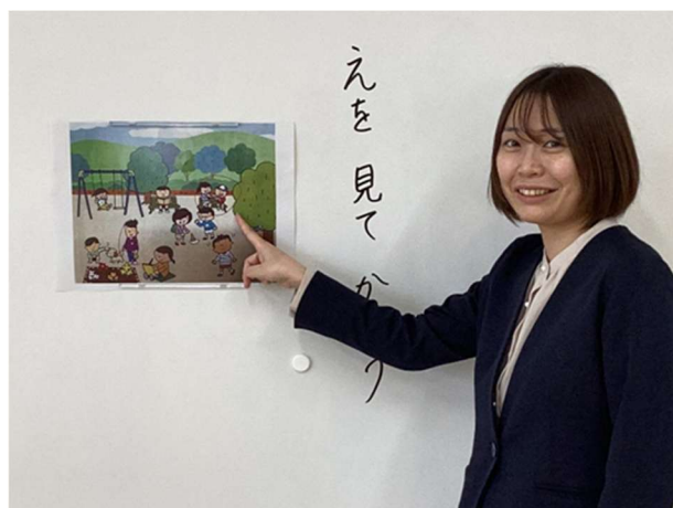
(勤務歴) 青森県立八戸第二養護学校 (H30～) 青森県立七戸養護学校 (R3～) 青森県立青森第一養護学校 (R7～)