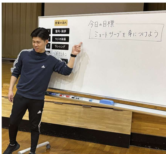
(勤務歴) 青森県立浪岡養護学校 (R6～)