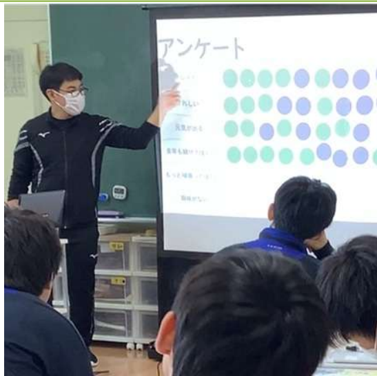
(勤務歴) 青森県立青森第一養護学校 (R3～) 青森県立弘前第一養護学校 (R6～)