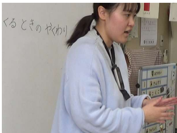
(勤務歴) 青森県立弘前聾学校 (R7~)