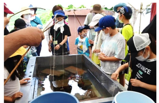
<体育館横テント下での活動の様子>