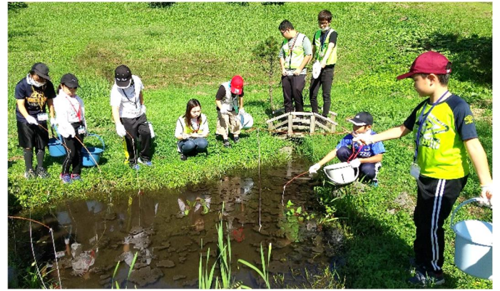
<ザリガニ釣りの様子>