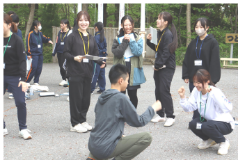
「ボランティア入門講座」