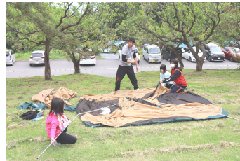
「ファミリースプリングキャンプ」