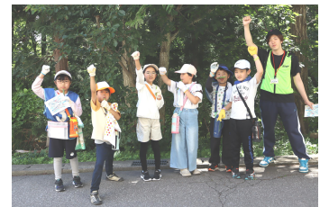
「9歳アドベンチャーキャンプ」