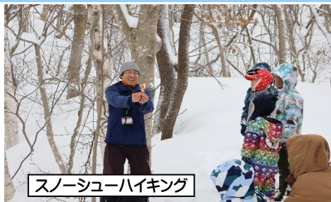
スノーシューハイキング

令和8年 1月31日(土) 9:45~14:00 受付:9:00~ 場所:自然の家玄関 対象 小・中学校の児童生徒を含む保護者とその家族 参加費 無料 昼食は持参も可能です。 ただし、昼食希望者は昼食代として、下記料金を 受付にてお支払い下さい。 会場 県立梵珠少年自然の家