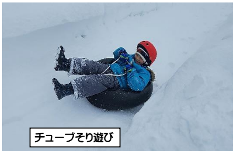
チューブそり遊び