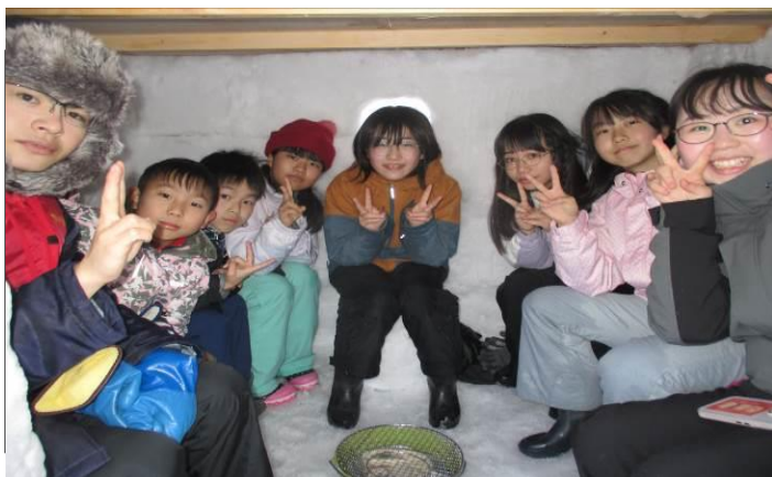
【かまくら基地でワイワイ】

主催 青森県立梵珠少年自然の家 会場 梵珠少年自然の家 対象 小学4年生～中学2年生の児童生徒 募集人員 30名