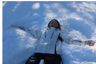
【ふわふわの雪にザブーン】