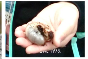
カブトムシの幼虫