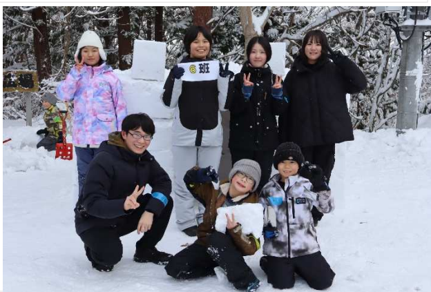
6班。メンバーの明るさが光ります。