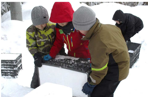
ブロックが高くなると、協力しないと積みません。