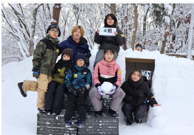
4班。なかよし感があふれます。