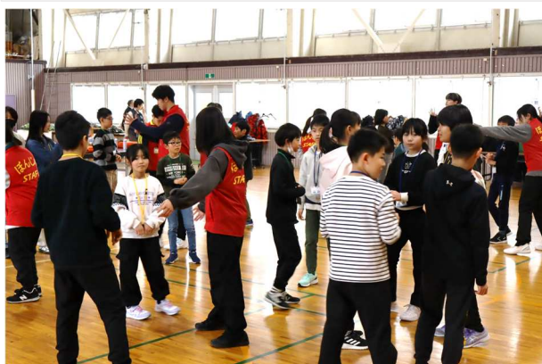
誕生日順に並ぶ「バースデーチェーン」。声は出しません。