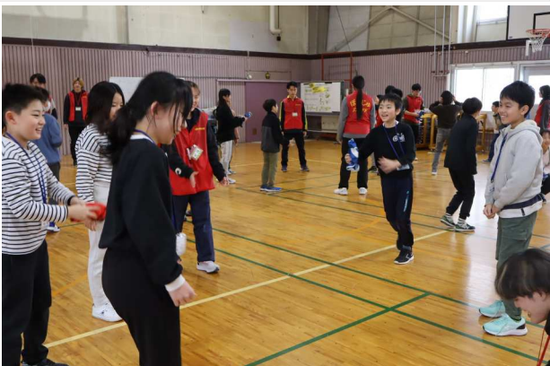
名前を呼んだ相手にトスする「ネームトス」。