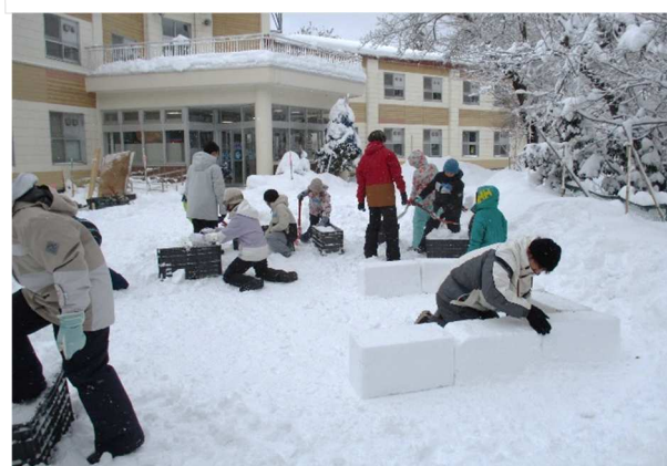
できたブロックを、入口が開いた四角形に並べます。