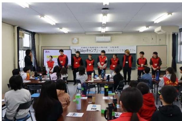
出合いのつどいです。いよいよスタートです。