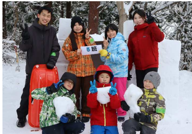
5班。一生懸命作ったブロックの残りと共に。

明日以降の天気予報があまり良くなかったため、1つの班で1つの基地を作るところを、今日のうちに2班合同で3つ作ることにしました。