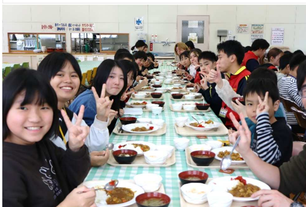
今日のお昼ご飯はカレー。午後の活動の腹ごしらえ。