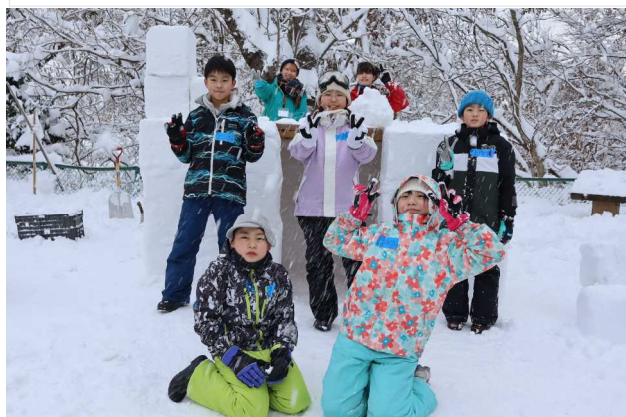
2班。ダイナミックなポージングです。