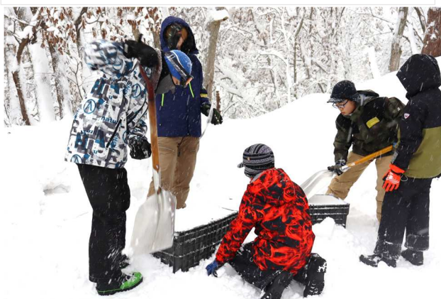
かまくら基地作り開始。まずは雪ブロックを作り、