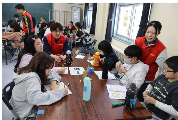
キャンプでの係と、自分の目標を決めました。