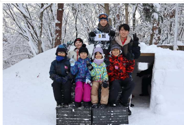
3班。リンゴ箱を使ってピシッと決めます。