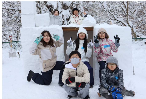
完成です！1班。個性あふれるメンバーです。