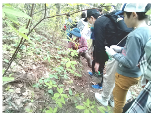
小さな可憐な花、発見。