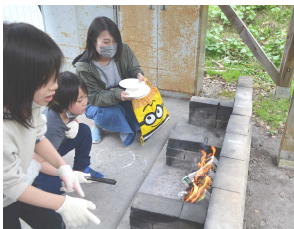
うま〜焼けるか心配…。