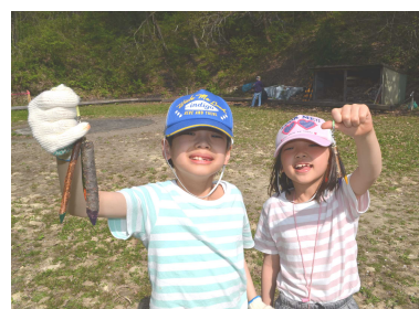
オリジナルのストラップの完成！