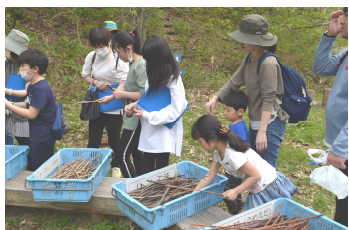
好みの小枝を選びます。