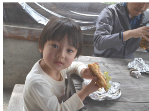
おいしそうにできました。