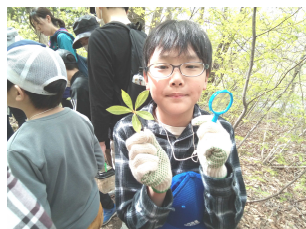
おいしい山菜、コシアブラ。