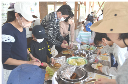
春キャベツなどをサンドします。