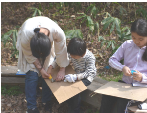
カッターなどで先を削ります。