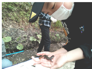
かわいいトウホクサンショウウオ。