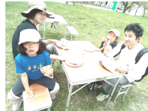
家族でゆったりランチタイム中。