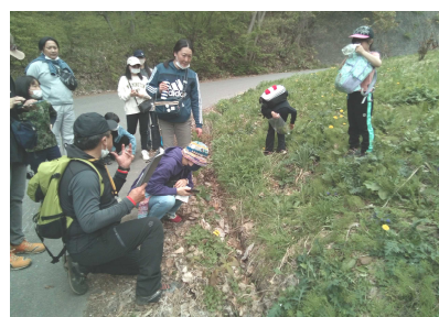
珍しいニホンタンポポを見つけました。