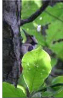
【アカゲラ】 キツツキの仲間です。「ゲッ！ゲッ！」という鳴き声 が特徴だよ。