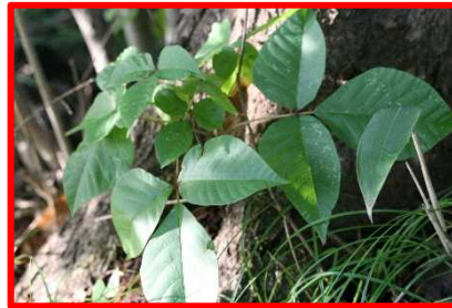
【キケン！ ツタウルシ】 これもさわらないで！ヤマウルシよりも強力だよ。3枚の葉とはっきりした葉のすじが特徴的。