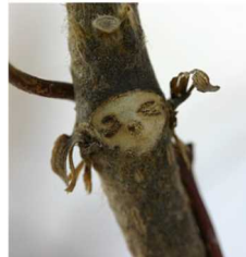
【クスの葉痕】 よく見ると、葉っぱのとれたあとが、なんだか顔に見えませんか？