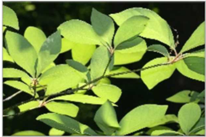
【オオバクロモジ】 枝をおって、においをかいてみよう。 とってもさわやかな、いいにおいがします。