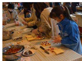
みんな大好きイチゴチョコ