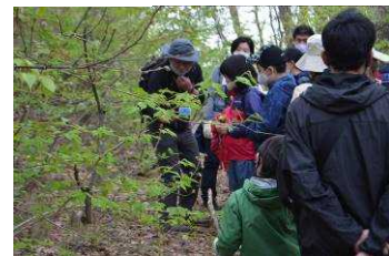
オオバクロモシ、いい匂い