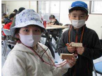
好きな模様や絵を書きました