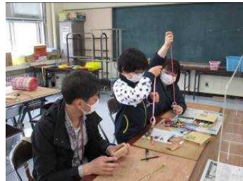
好きなパラコードを選びます