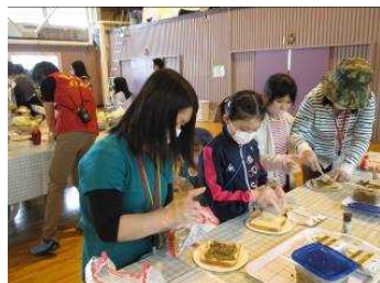
おすすめ、バツケみそ&チーズ