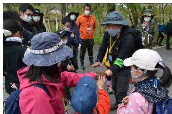
ふわふわしたりスの巣を発見