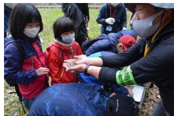
こちらは卵。もうすぐ生まれそう