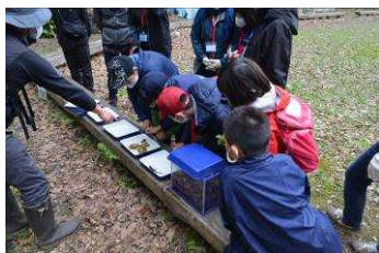
トウホクサンショウウオの観察