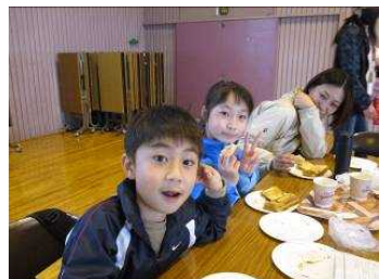
おいしくてこの笑顔！