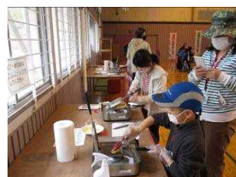
ホットサンドメーカーに挑戦中