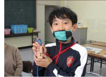
バーニングペンも使いました