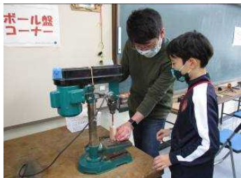
ボール盤で穴を開けます