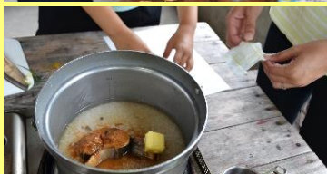
グルメランド:さばター飯