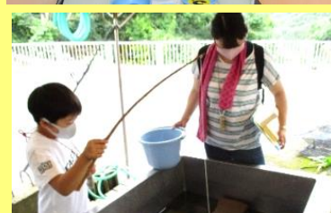
わくわくランド:ザリガニ釣り