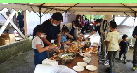
野外炊事朝食「スキレット料理」①