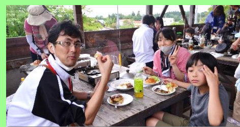
野外炊事朝食「スキレット料理」②

「テント泊をするのは初めて!」という親子がほとんどの「テント泊の部」でしたが、抽選で選ばれた18家族の皆さんが貴重な体験をすることができました。野外炊事でも、ダッチオープンやスキレットといった道具を使って料理するのは初めての方が多く、「おいしくできたので、今度は家族だけで作ってみたい!」という声が多く聞かれました。親子で過ごす楽しいひとときとなったようです。