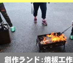
創作ランド:焼板工作