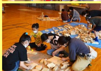
創作ランド:トンカツ工作