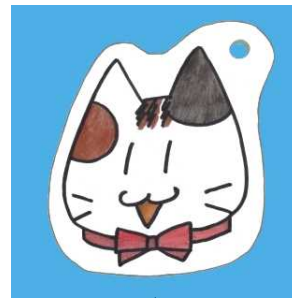
<色鉛筆で色をぬったもの>