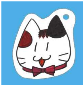
<油性マジックで色をぬったもの>