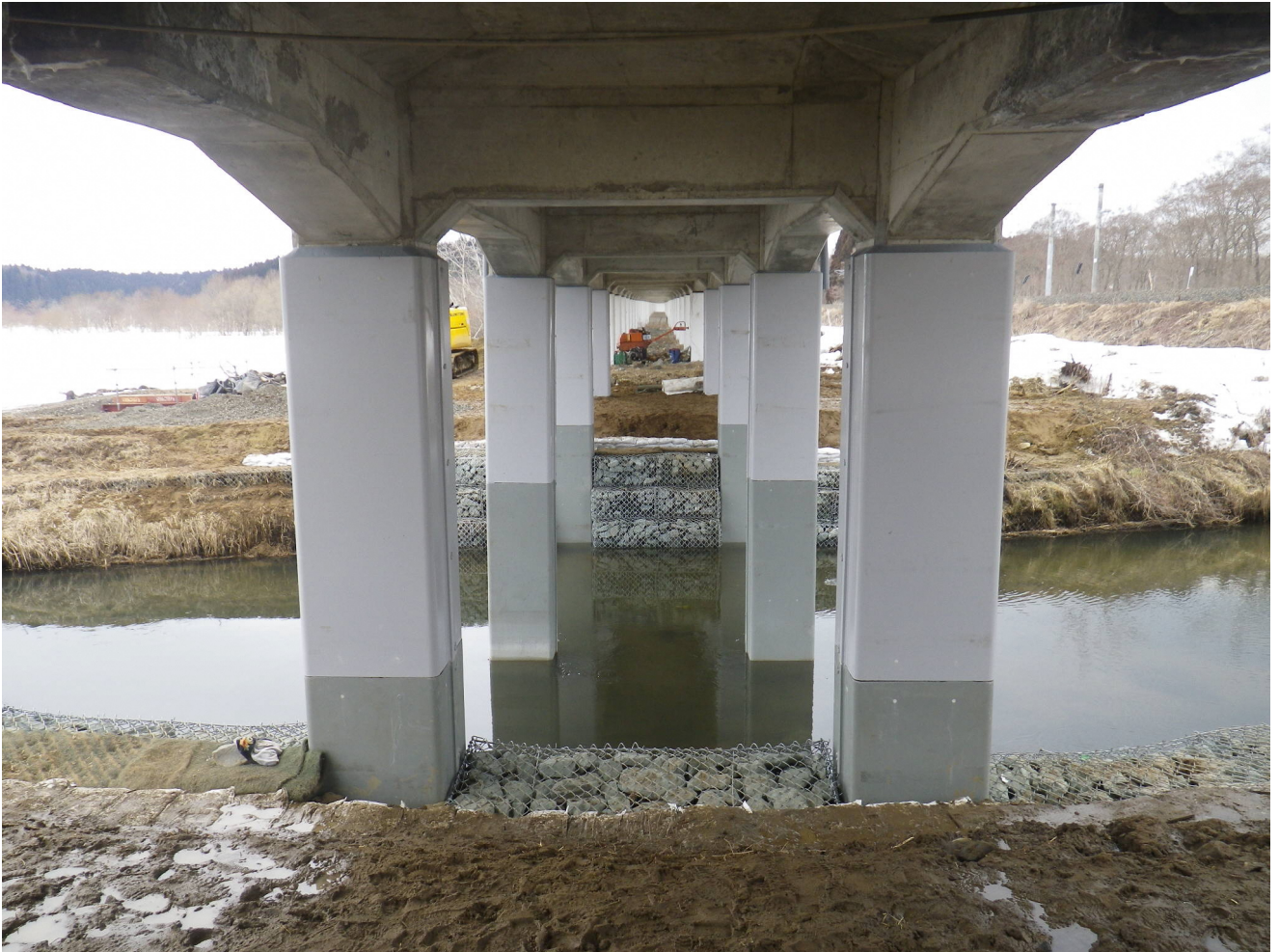
第1 小川原高架橋耐震補強（小川原・上北町間）