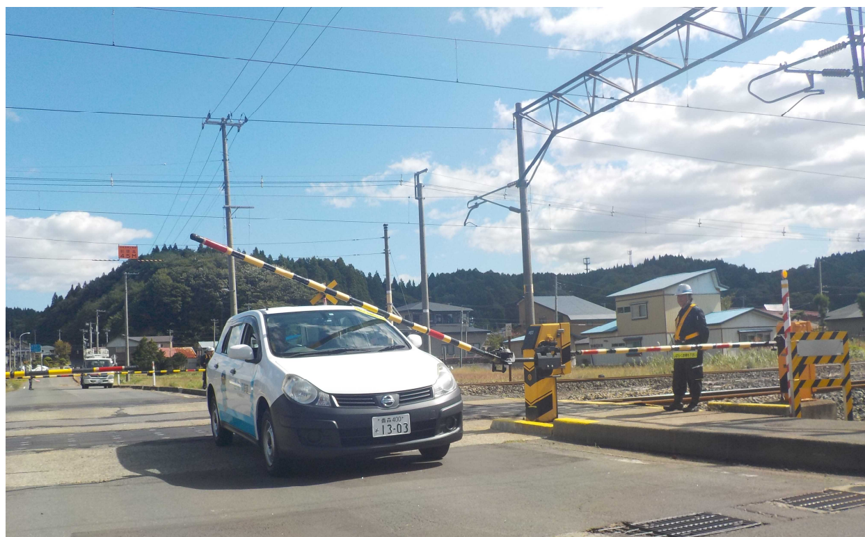
踏切事故防止訓練会（東北町・旗屋道踏切）