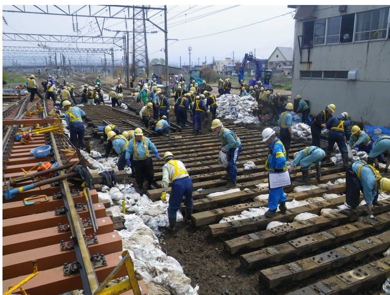
分岐器全交換（青森信号場構内）