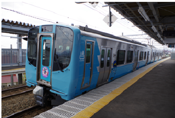
筒井駅に停車する新型車両「青い森703系」