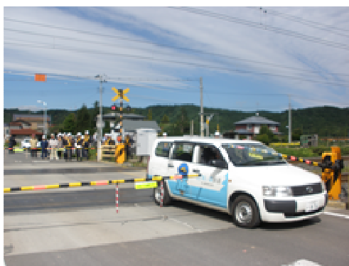
踏切事故防止訓練会（脱出訓練）

日本貨物鉄道(株)東北支社が主催した訓練に参加し、盛岡貨物ターミナル駅を会場に、機関車脱線の復旧等について訓練しました。（平成25年10月31日）