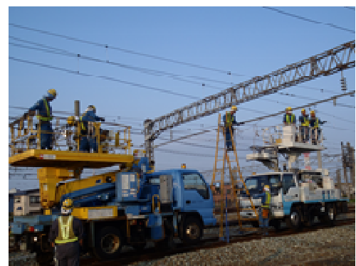
鉄道施設保守作業（トロリー線張替）