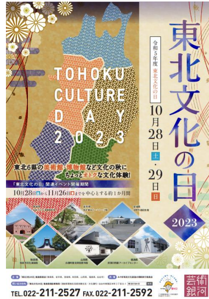
令和5年度ポスター