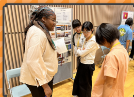
・グループバトル編・