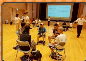
・ウォーミングアップ・