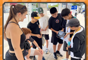
・フィールドワーク・