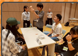
・新しい1000づくり・