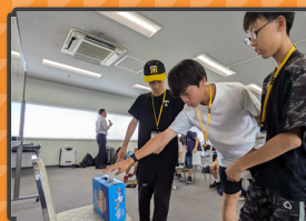
・仲間づくりチャレンジ編・