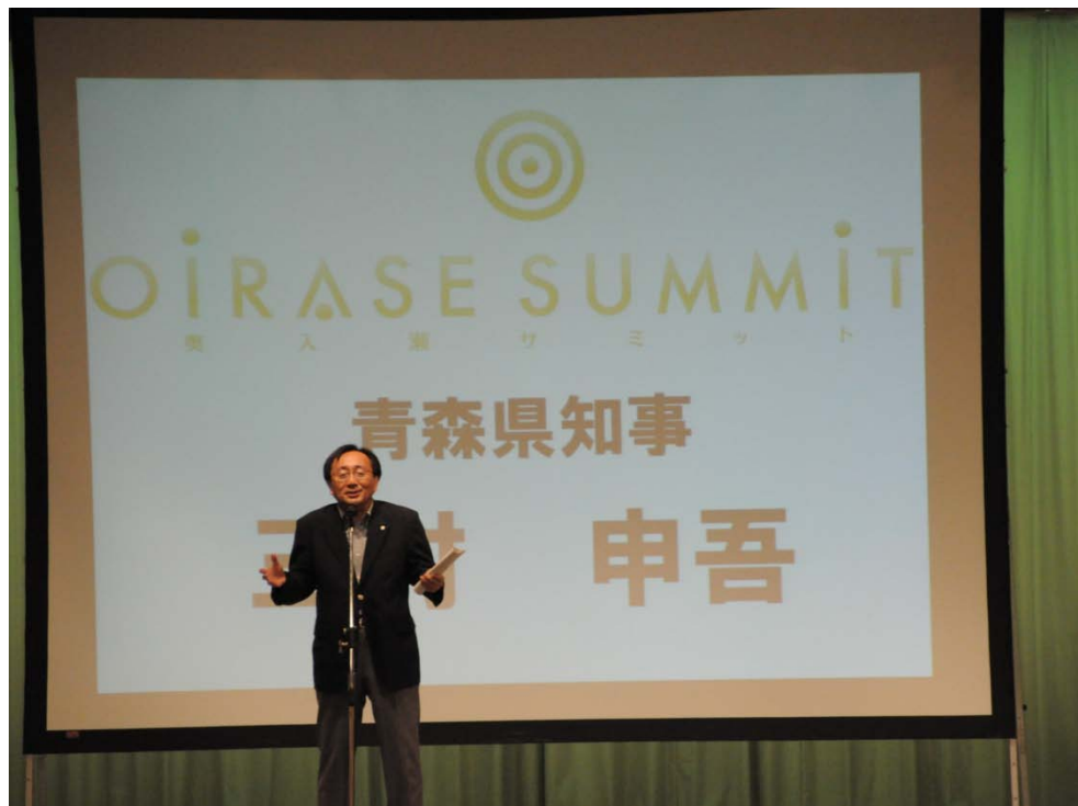
歓迎のあいさつ 三村申吾青森県知事