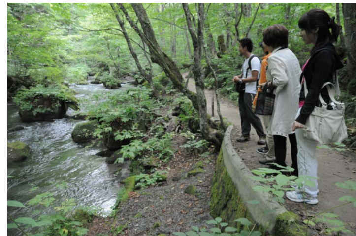
奥入瀬溪流ランブリング