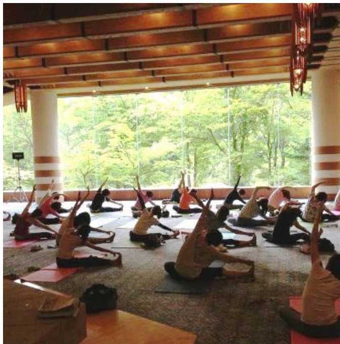
奥入瀬リラックスヨガ