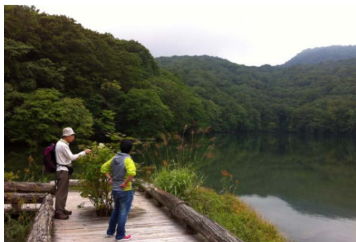
鳶の森ランブリング