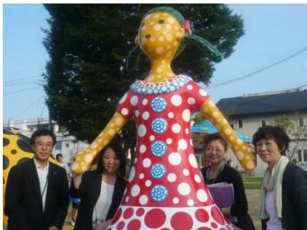
十和田市現代美術館