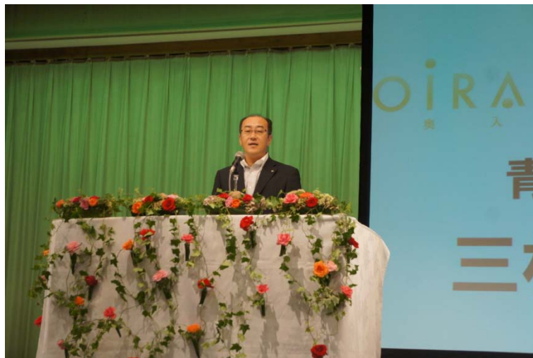
佐々木青森県副知事のあいさつ