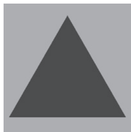
オレンジ色地に青の三角形