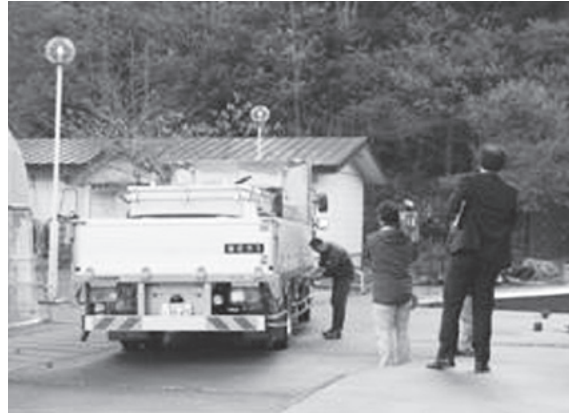
泊漁協（六ヶ所村）から水産総合研究所（平内町）への輸送試験の状況