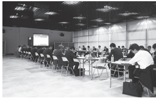
八戸港BCP策定委員会

以上、合計5回の会議を経て、八戸港BCP（事前対策及び発災後のアクションプラン、津波避難誘導計画）を取りまとめる予定。