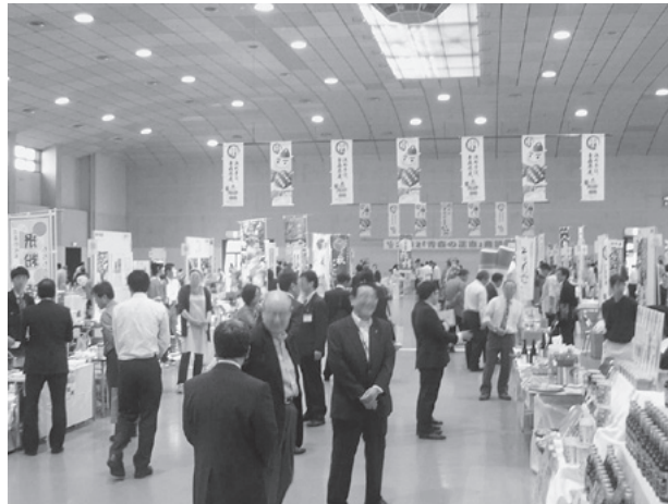
「青森の正直商談会」の開催状況