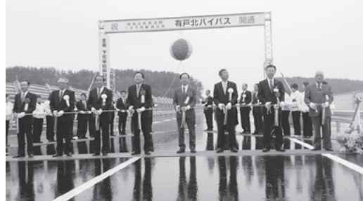
有戸北バイパス開通式