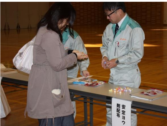
安定ヨウ素剤配布（東通村）