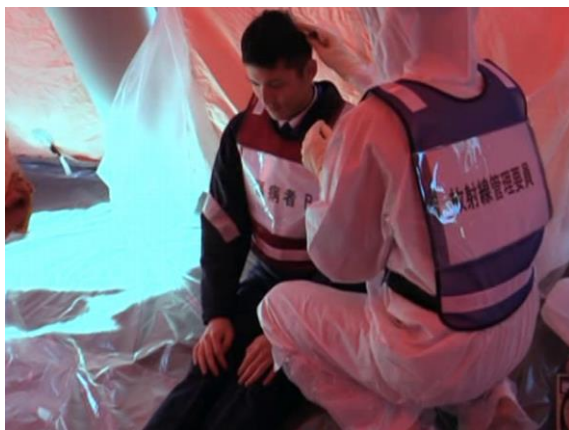
傷病者搬送（簡易除染）