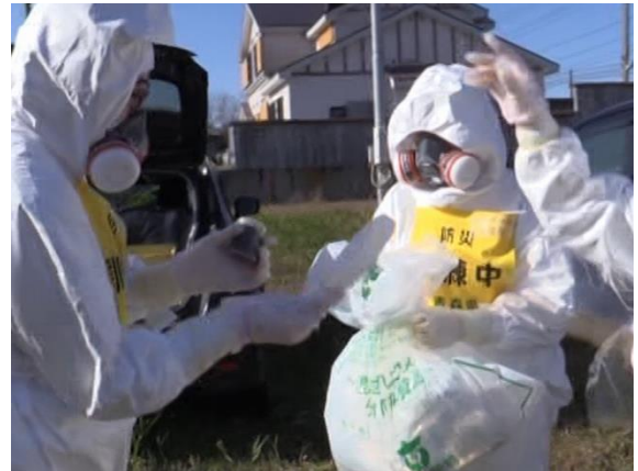
緊急時モニタリング（試料採取）