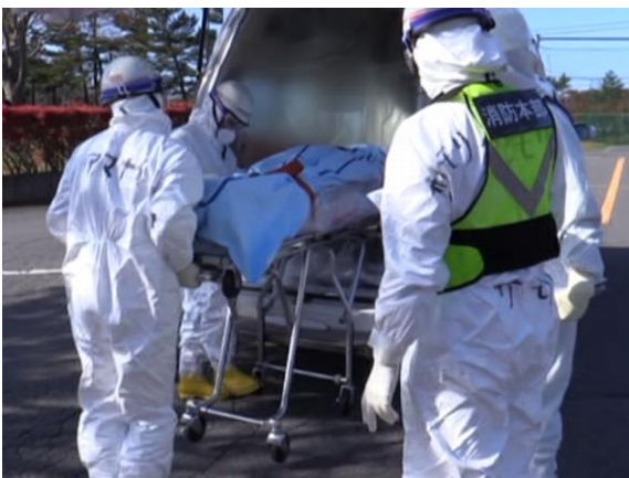
傷病者搬送（引継場所到着）