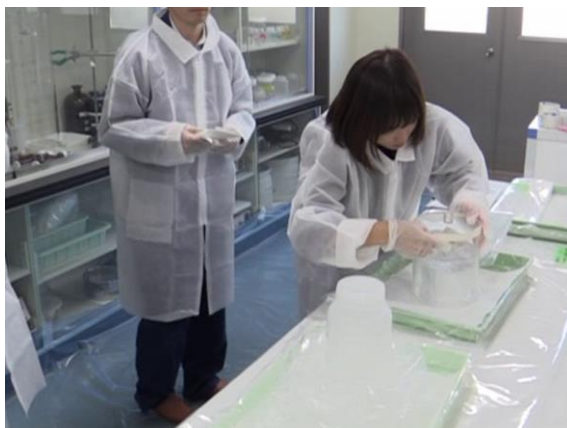
緊急時モニタリング（試料分析）