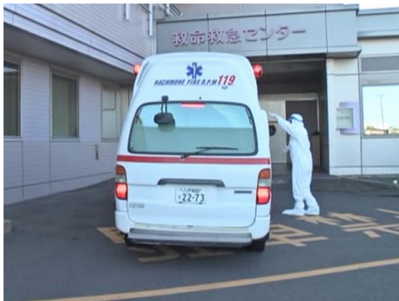
傷病者受入（傷病者到着）