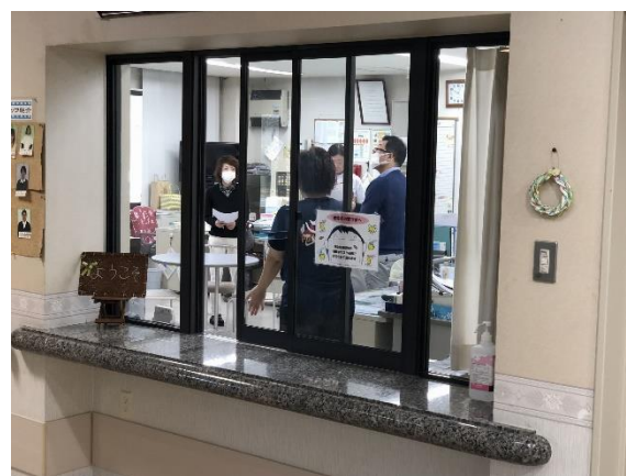
社会福祉施設における屋内退避（六ヶ所村）