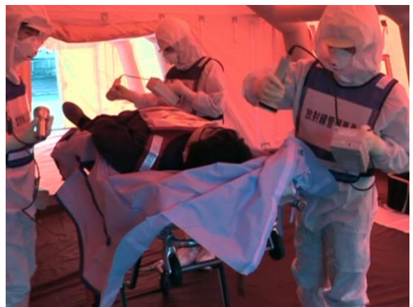
傷病者搬送（汚染検査）