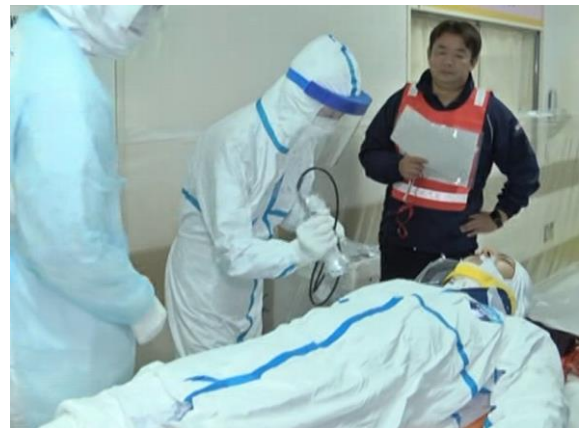
傷病者受入（汚染検査）