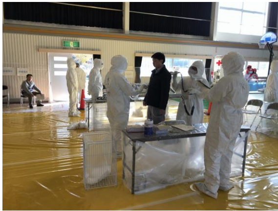
避難退域時検査（指定箇所検査）