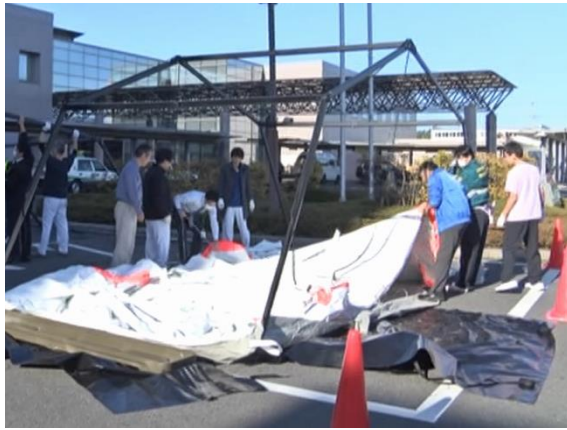
傷病者受入（テント設営）