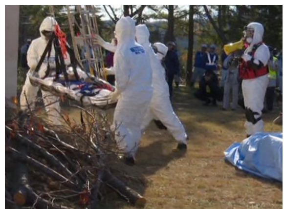
土砂災害救助・救出訓練