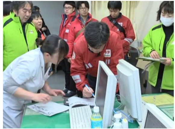
傷病者受入（原子力災害医療派遣チーム到着）