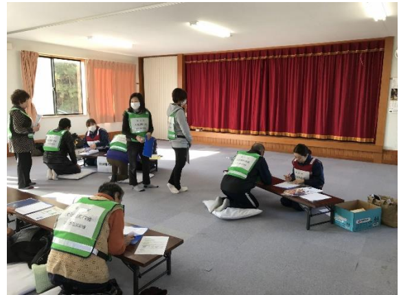
一時集合場所開設・運営（横浜町）