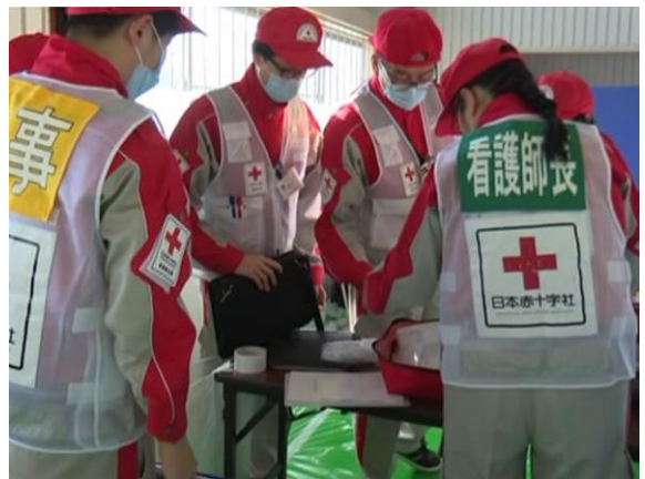
救護所開設・運営