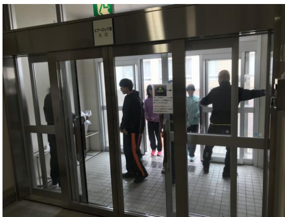
学校における屋内退避（むつ市）