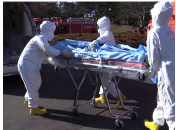
傷病者搬送（引継ぎ）