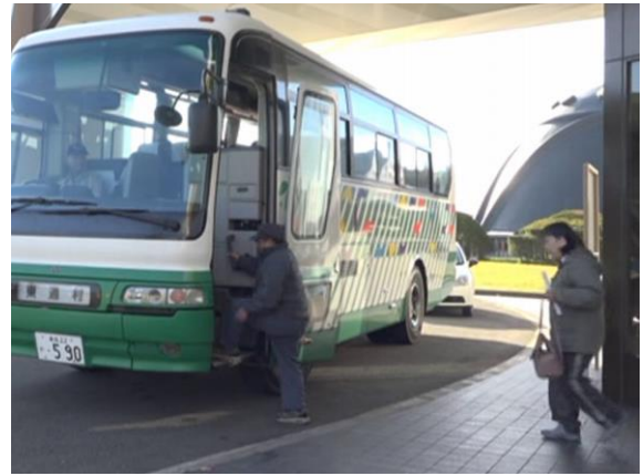
一時集合場所からのバス避難（東通村）