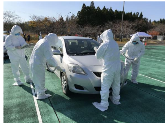
避難退域時検査（確認検査）