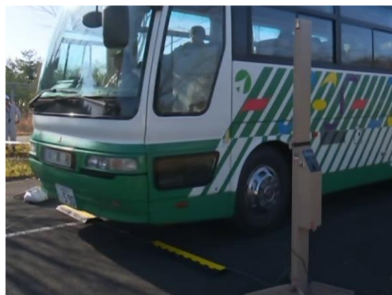
避難退域時検査（指定箇所検査）