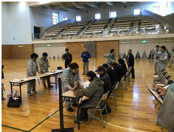
一時集合場所開設・運営（東通村）