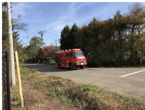
消防団による住民広報（野辺地町）