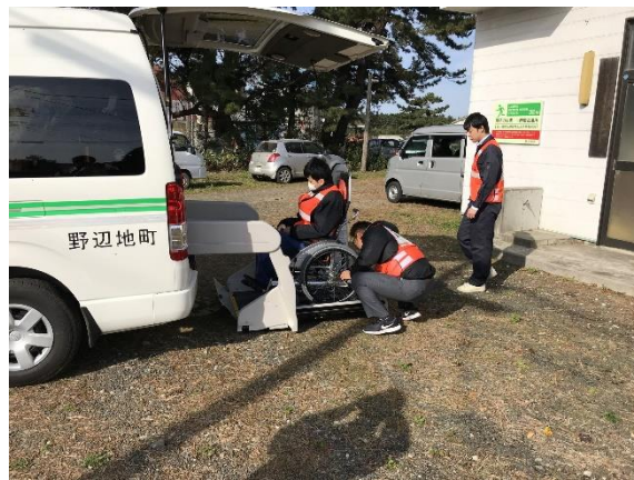
福祉車両による要配慮者避難（野辺地町）