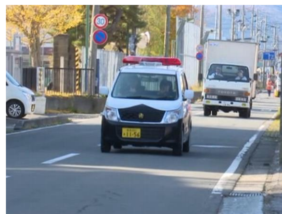
青森県警察本部による住民広報（むつ市）