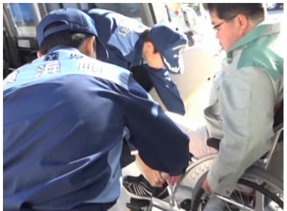
自治体連携による要配慮者避難（横浜町）