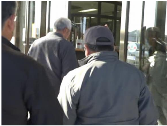
一時集合場所への参集（東通村）