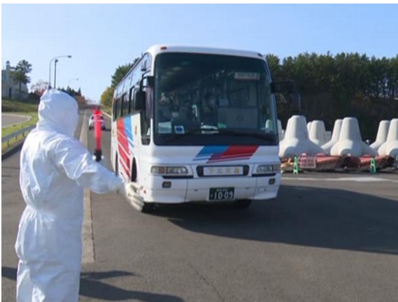
車両保管場所への誘導