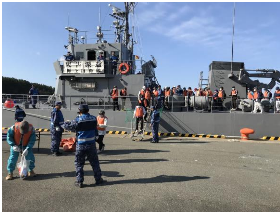
海上自衛隊船舶による避難（むつ市）