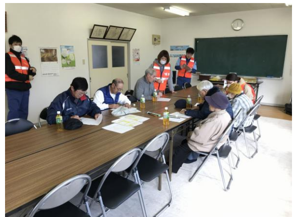
安定ヨウ素剤配布（野辺地町）