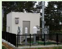
モニタリングステーション モニタリングポスト (空間放射線量率を連続測定)