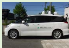
モニタリングカー (車を使った走行測定)